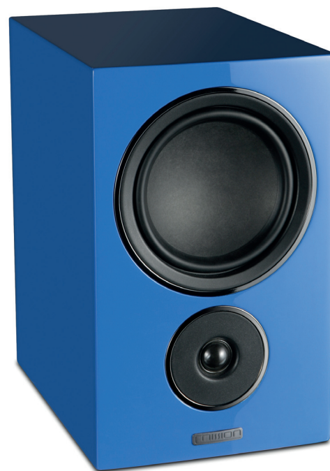
Ein Blickfang mit edler Hochglanzlackierung: Die LX-2+ ist als limitierte Jubiläums-Sonderedition für einen kleinen Aufpreis erhältlich

Grundsätzlich basiert die neue LX-2+ auf einem bereits am Markt erfolgreichen Modell namens LX-2. Das „+“ im Namen unseres Testmusters deutet auf ein leicht vergrößertes Gehäuse und etwas größeren Tieftöner im Vergleich zum Standardmodell hin. Die Abmessungen der LX-2+ von rund 214 x 345 x 300 Millimetern sind zwar immer noch recht handlich, doch das leicht größere Volumen verleiht der LX-2+ eine deutlich besser Tiefbassperformance. In dem Bassreflexgehäuse arbeitet ein Tiefmitteltöner mit 135-mm-Membran, die aus einem Fasermaterial gefertigt wurde. Dank der fehlenden Dustcap und dem sauber und bündig eingebauten Treiber sieht die Mission LX-2+ sogar ziemlich elegant aus. Auch trüben keine Löcher für die Befestigung der mitgelieferten Schutzgitter die mattlackierte Schallwand der Box, unsichtbare Magneten unter der Lackschicht sorgen für sicheren Halt der Frontbespannung. Für eine dynamische Hochtonwiedergabe kommt eine recht große 25-mm-Gewebekalotte zum Einsatz. Das folierte Gehäuse der LX-2+ ist ordentlich verarbeitet und in den Versionen