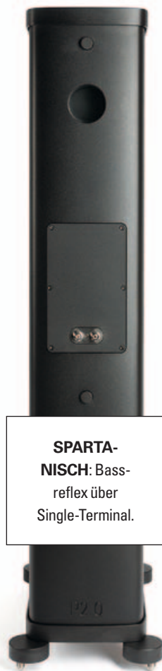
SPARTANISCH: Bass-reflex über Single-Terminal.

Wer kennt die Kombination zu diesem Klang-Tresor? Erster Tipp: Ein starker Verstärker sollte die Kraft anliefern. An kleinen Röhren-Amps wirkt das Klangbild eher wattig. Wie klingt dann die P2.0 in der Realität unseres Hörraums? Zuerst wirkt sie kühl. Doch das ist ein Missverständnis. Sie ist einfach nur ehrlich. Ein schlechtes CD-Mastering legt sie schonungslos offen. Doch bei 24 Bit und DSD wird es plötzlich samtig. Gar nicht zu reden von ei-